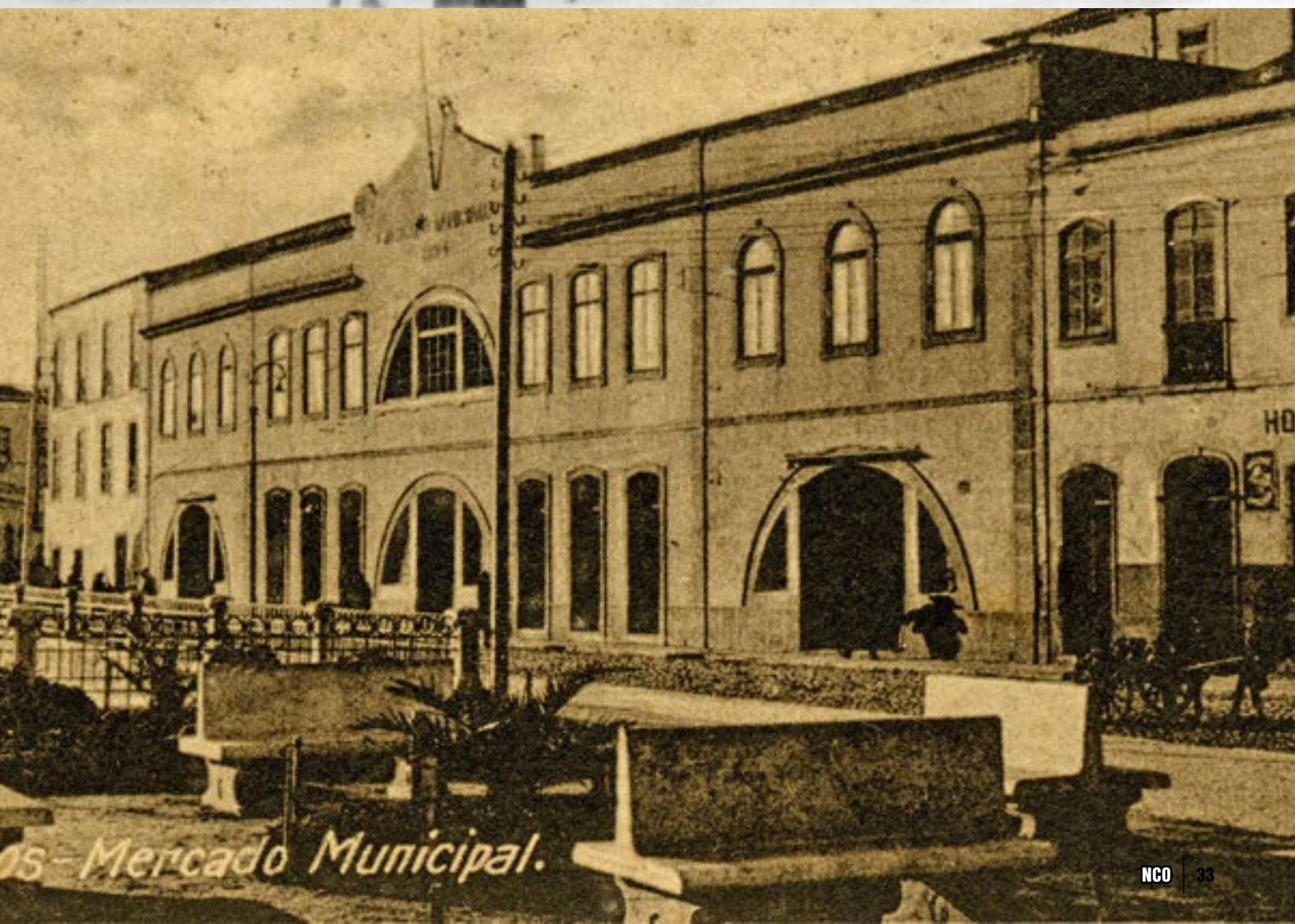
is - Mercado Municipal.