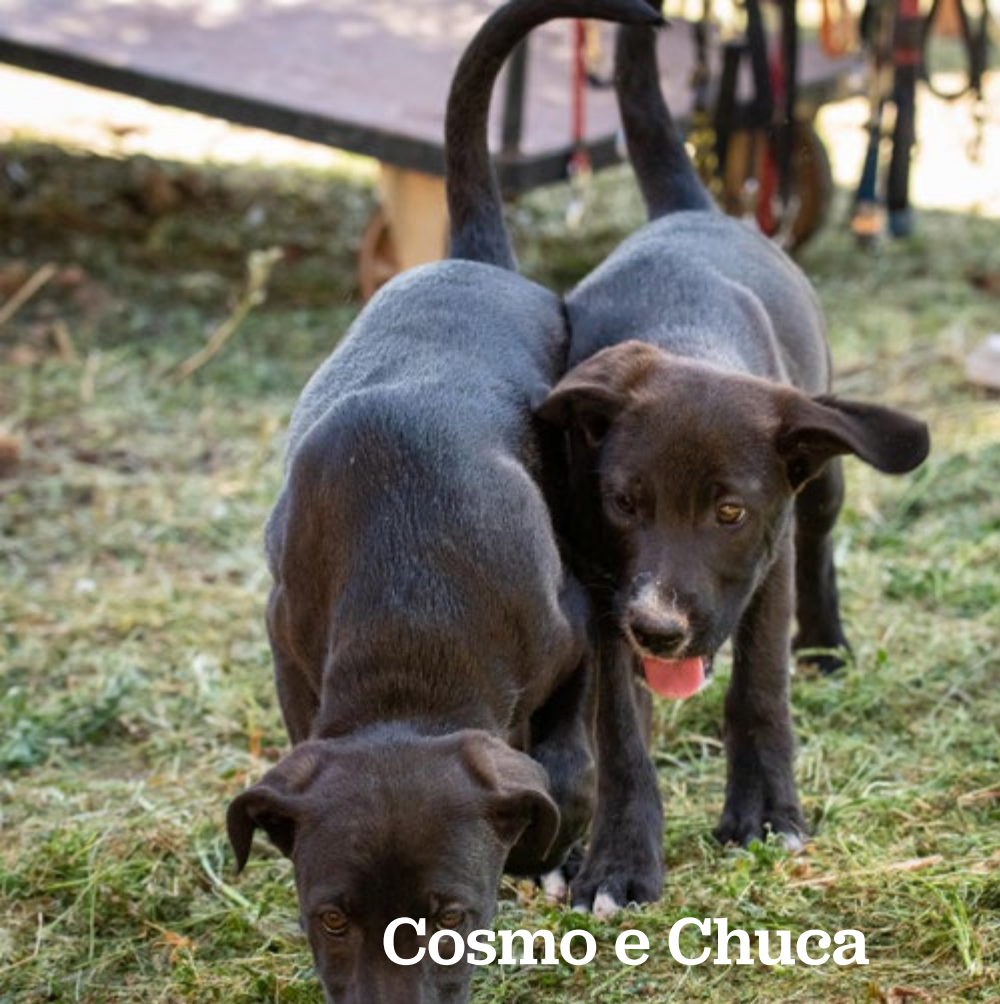
Cosmo e Chuca

O Cosmo e a Chuva (fazem as delícias de toda a gente. Dois cachorrinhos com 3 meses de idade, super brincalhões e curiosos. Estão para adoção no nosso abrigo.